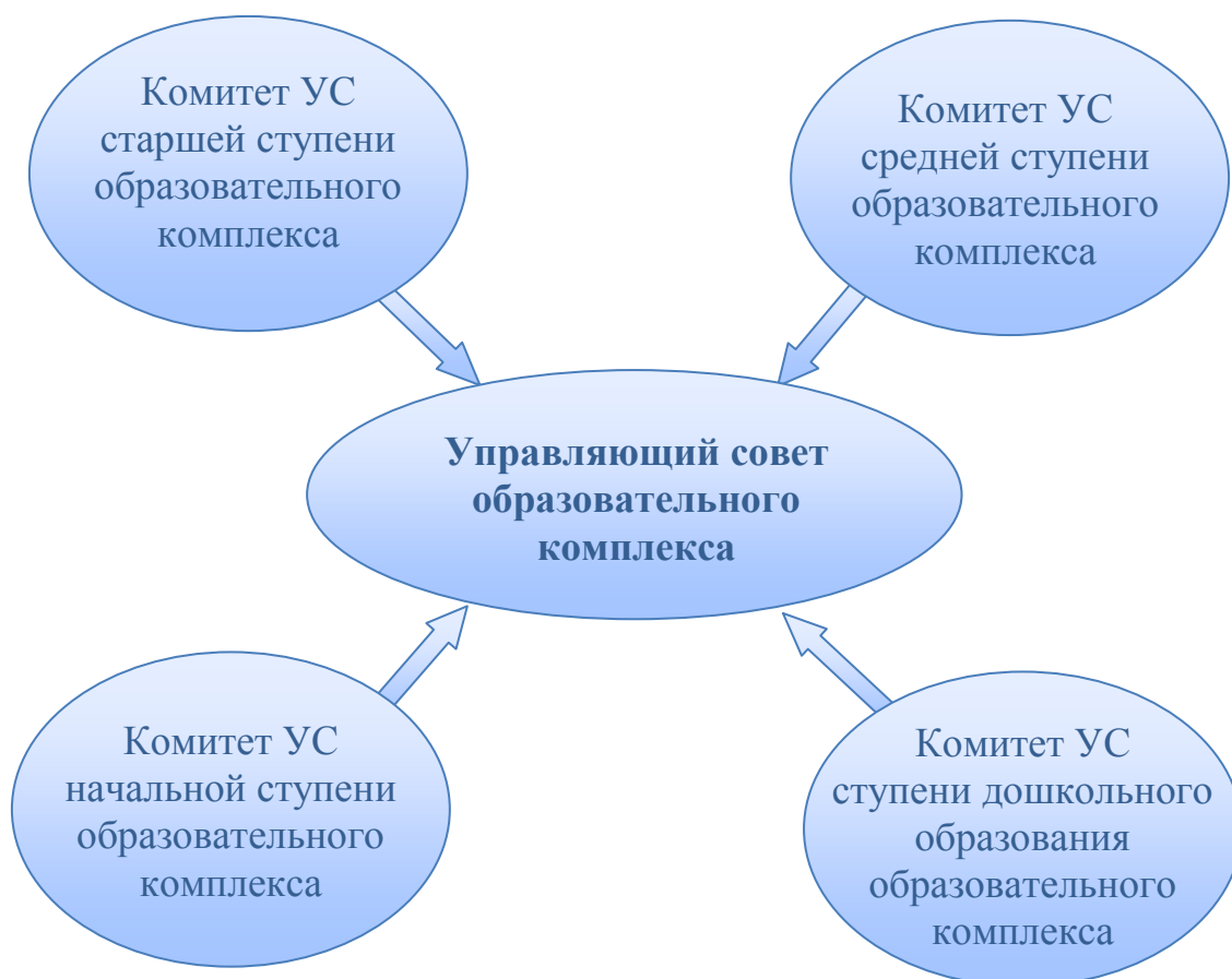
Рис.2. Управляющий совет образовательного комплекса. Второй вариант организации.

соответствующей ступени (структурного подразделения) – это вопрос открытый и ответ на него зависит от объема функций и полномочий комитета. То же самое можно сказать и в отношении «структурно-территориального» комитета, рассмотренного в первом варианте.